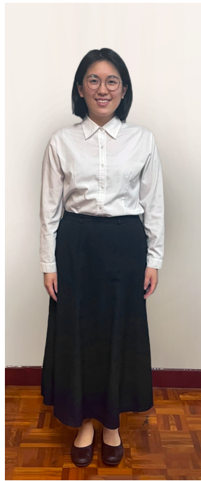
姊妹聚會正式服裝：